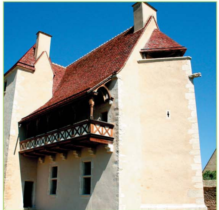
Château de Chezelle (18)